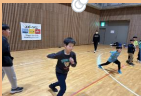
リズミトレーニング