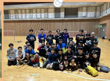
高校生のお兄さんお姉さんと★