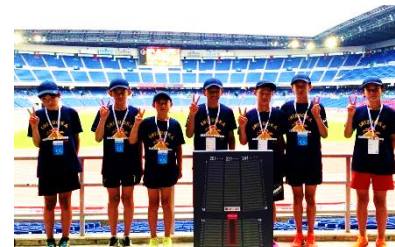
日産スタジアム (神奈川県)